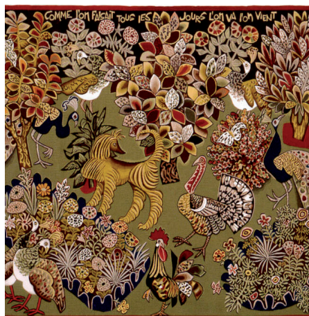
Garden party, D'après Dom Robert©Musée Dom Robert

Corpus de textes romantiques et des écrits d'Eugénie et Maurice de Guérin