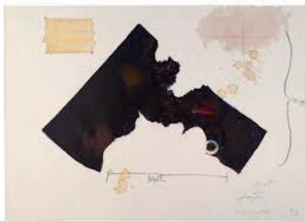
Llull- Tàpies