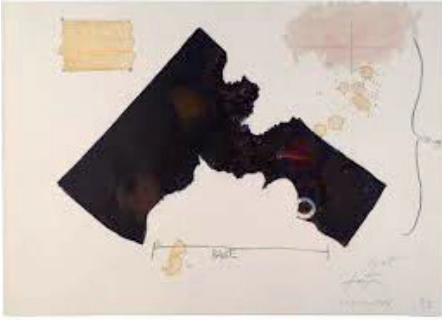
Llull- Tàpies