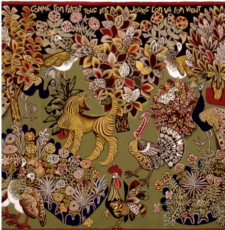
Garden party, D'après Dom Robert

Corpus de textes romantiques et des écrits d'Eugénie et Maurice de Guérin