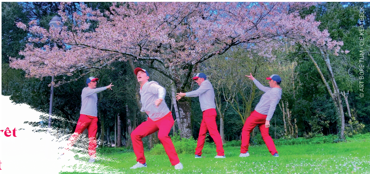
© ART BORE TUM - CIE KEATBECK